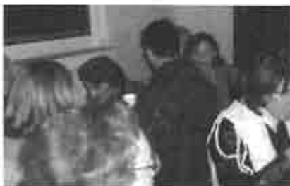
Compartiendo juntos un cafecito

En junio iniciamos una nueva serie de mensajes, en la que nuestro moderador habló sobre la victoria que tenemos en Cristo, pues a través de Cristo somos más que vencedores sobre las preocupaciones, las dificultades, el temor y el egoísmo.