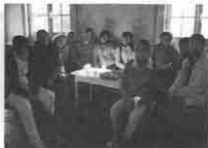
Grupo de jóvenes de Acción Social

A su familia, madre, hermanos e hijas extendemos nuestro más sentido pésame y que Dios los consuele.