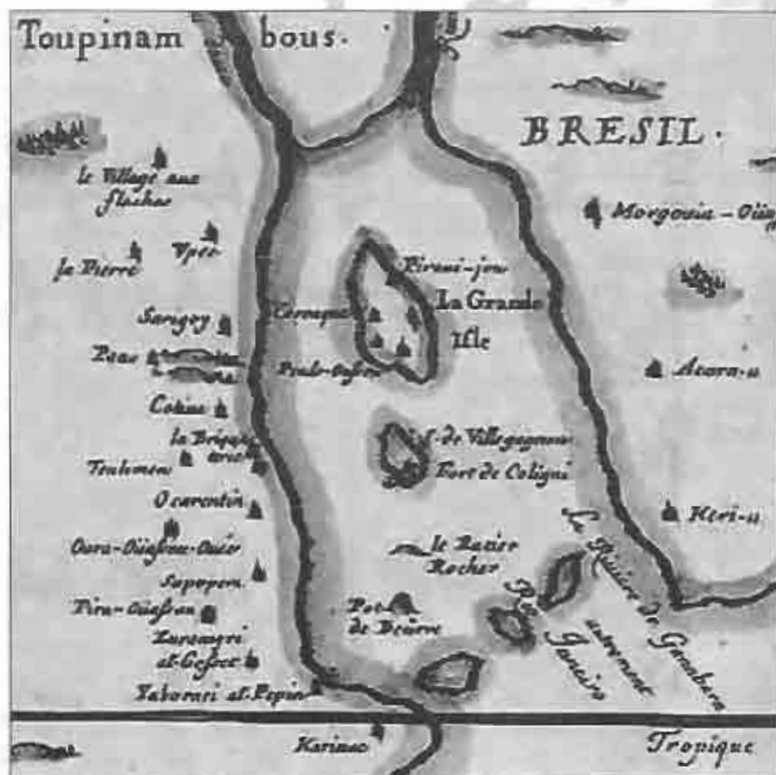
Antiguo mapa de la bahía de Guanabara