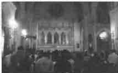
Una nutrida asistencia al culto